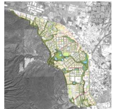
Bajío de la Primavera, Zapopan, Jalisco, 2010