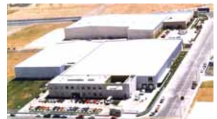
Industrias Kirkwood México, México, 1998