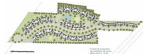
Las armas, Tlalnepantla, México, 2003

RANCHO DE DON ANTONIO QUMA DE HIDALGO S.A. DE C.V. Tizayuca, Hidalgo. 40 Hectáreas.