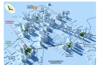
Visión Naucalpan a 20 años, 2010.