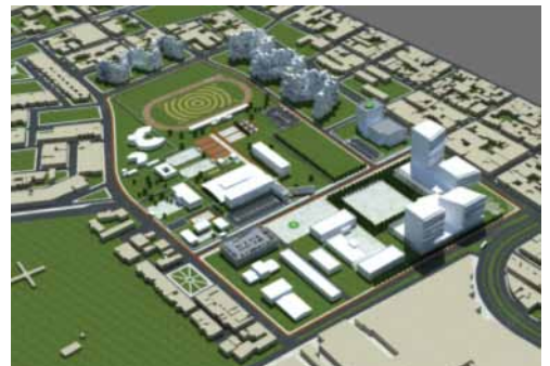
Subcentro metropolitano de Zapopan, 2009