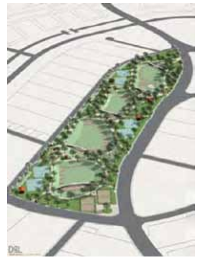
Parque central, Huehuetoca, Edo. de México, 2007

PLAN MAESTRO URBANO NUEVA CASTILLA INFONAVIT / SECRETARIA DE DESARROLLO URBANO DEL ESTADO DE NUEVO LEON Monterrey, Nuevo León. 1200 ha.