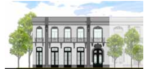
Edificio Milán 48, Col. Juárez, México. 2010

Proyecto y obra de la remodelación de edificio con 14 departamentos. Colonia Cuauhtémoc, Del. Cuauhtémoc, México, D.F.