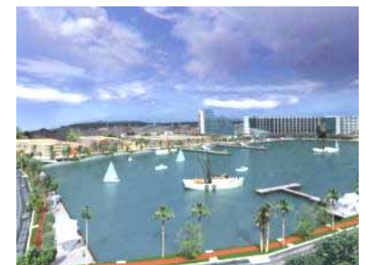
Malecón y Marina, Puerto Peñasco, Sonora, 2008