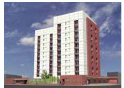
Villa Toscana, Ecatepec, México, 2003

Cliente Proyecto para la subdivisión y remodelación de casa habitación. Colonia Lomas de Chapultepec, Delegación Miguel Hidalgo, México, D.F.