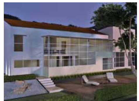
Casa Trasmonte, Cuajimalpa, México, 2011

Anteproyecto para la remodelación de casa residencial. Fracc. Bosques de Santa Fe, Colonia San Mateo Tlaltenango, Delegación Cuajimalpa, México, D.F.