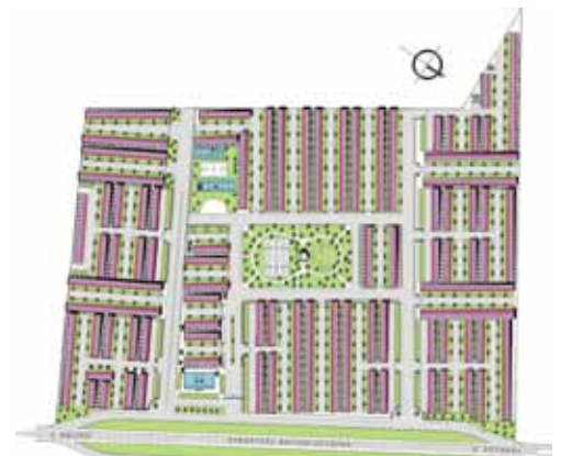
Rancho Don Antonio, Hidalgo, México, 2001

LOS LOBOS GRUPO ICA / PIADISA Tijuana, Baja California. 15 Hectáreas.