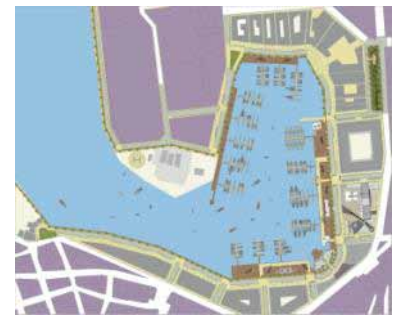
Malecón y Marina, Puerto Peñasco, Sonora, 2008

CONJUNTO URBANO VISTA REAL URBI Valle de México. Cuautilán Izcalli, Estado de México. 5 Hectáreas.