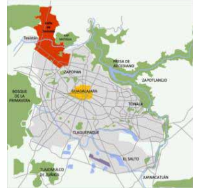
Valle de Tesistán, Zapopan, Jalisco. 2011

PLAN MAESTRO URBANO CIUDAD SATÉLITE DE TEPIC. Tepic, Nayarit, México Dinámica S.A. de C.V. 1343 Hectáreas.