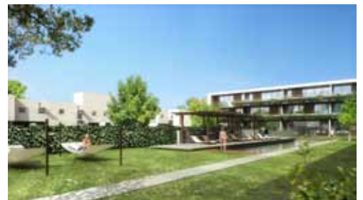
Reserva del Caribe, Cancún, México, 2007