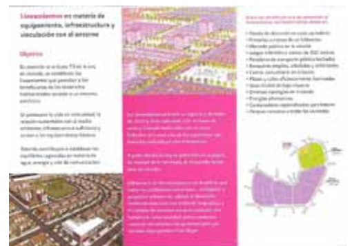
Reglamento artículo 73, México, 2007