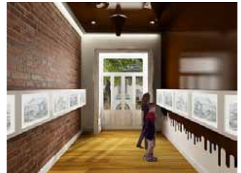
Mucho, Col. Juárez, México, 2012

Proyecto ejecutivo y supervisión de obra Fracc. Bosques de Santa Fe, Colonia San Mateo Tlaltenango, Delegación Cuajimalpa, México, D.F.