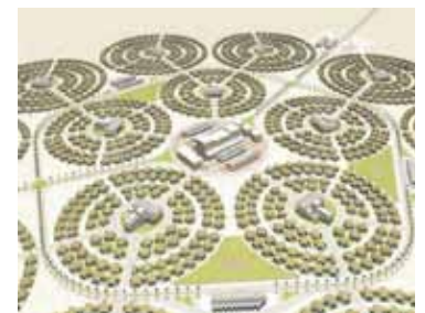
Distrito para trabajadores, Abu Dhabi, 2005