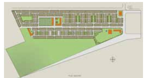
Los Lobos, Tijuana, México, 1993