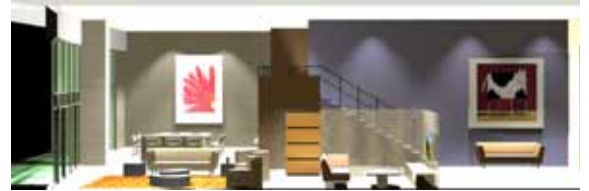
Departamento Chapur, Cancún, 2006

DEPARTAMENTO T23 Pedro Gil Proyecto para la remodelación y diseño de interiores de un departamento. Colonia Ricardo Flores Magón, Naucalpan, Edo. de México.