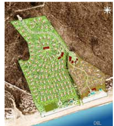
Four seasons villas and resort, 2005