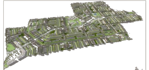
Conjunto urbano Atardeceres, Valle de Tesislán, Jalisco, 2010