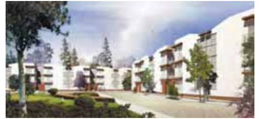
Ciudad Bicentenario, Hidalgo, 2008

PLAN MAESTRO DEL FOUR SEASONS LOS CABOS VILLAS AND RESORT TRINITY INVESTMENTS LLC Los Cabos, Baja California Sur. 34 Hectáreas.