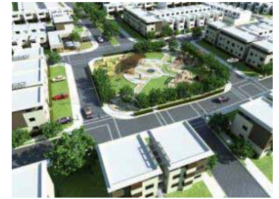
Fraccionamiento Campestre California, Tuxtla Gutiérrez, Chiapas, 2009

CONJUNTO URBANO HACIENDA SANTA ROSA. COMUNIDADES HOMEX Querétaro, Querétaro. 121 Hectáreas.