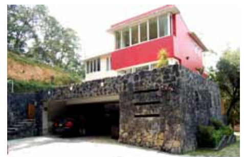
Casa Ramírez, Vallescondido, México, 2008

Proyecto y administración para la remodelación de casa residencial. Colonia Bosques de las Lomas, Del. Miguel Hidalgo, México, D.F.