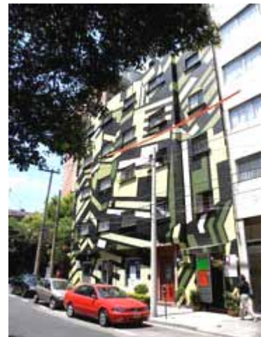
Edificio Lerma Duero, Cuauhtémoc, México 1996-2010

Col. Cuauhtémoc, Delegación Cuauhtémoc, México, D.F.